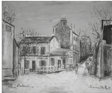
Maurice Utrillo: "Le Lapin Agile a Montmartre" 1948, olio su tela, cm 46x55