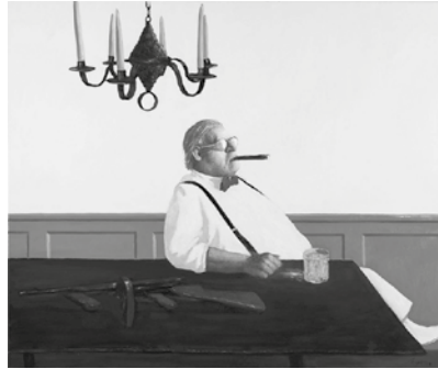
Julio Larraz: "Alcohol, tabacco and Firearms", 2019, olio su tela, cm 152x183.

ture, così come frammentate ci sono giunte a rappresentare gli archetipi dell'antichità. Delle sue opere Antonio Paolucci ha detto: "Forse la frattura allude al mistero dell'antico che si manifesta a noi per frammenti, per allusioni, per evocazioni come i riflessi di un'Atlantide scomparsa". Da ammirare "Per Adriano Oro", 2011, Ed. E.A., la scultura in bronzo, raffigurante un volto, unica realizzata con foglia d'oro. Osservando le diverse opere esposte si rimane colpiti dal modus operandi di Julio Larraz, l'artista cubano che combina le raffinate abilità di un disegnatore, la narrazione di un grande narratore e la surreale distorsione