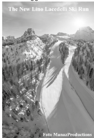
The New Lino Lacedelli Ski Run

Faloria: Tel. 0436 5889. Orario funivia 8.30-16.30. Sciovia Tondi di Faloria 8.30-16.30, Seggiovie: Vitelli 8.30-16.40, Rio Gere Pian de ra Bigontina 8.30-16.20, Pian de ra Bigontina 8.30-16.30. Cristallo: Tel. 0436 861035. Seggiovie Rio Gere - Son Forca e Padeon Son Forca 8.30-16.30. A Rio Gere ampio parcheggio.